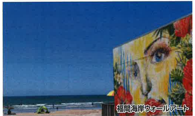
福間海岸ウォールアート